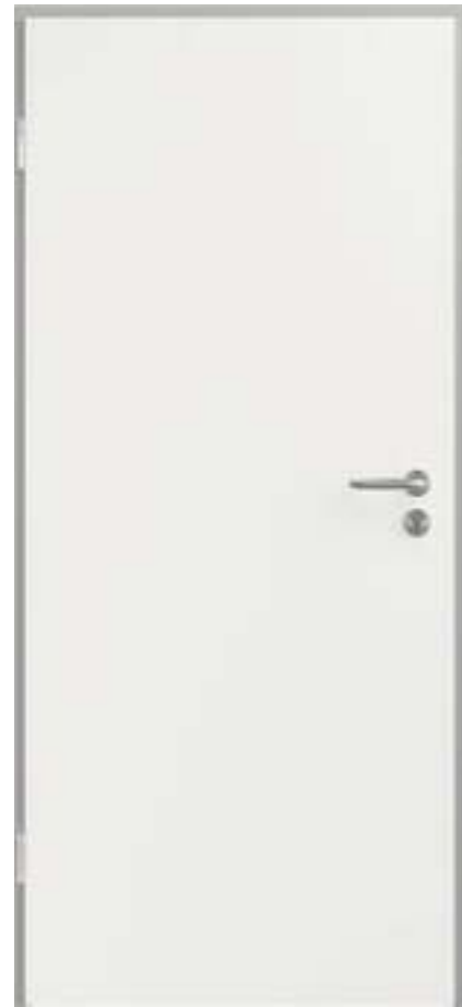
Türblatt Röhrenspantüren weiß lackiert, matt Stahlzarge