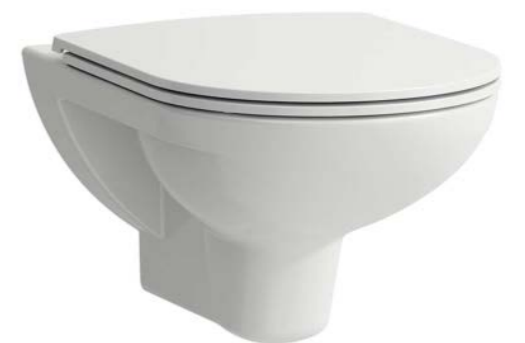
WC Laufen Pro ohne Spülrand mit Pro slim Sitz weiß