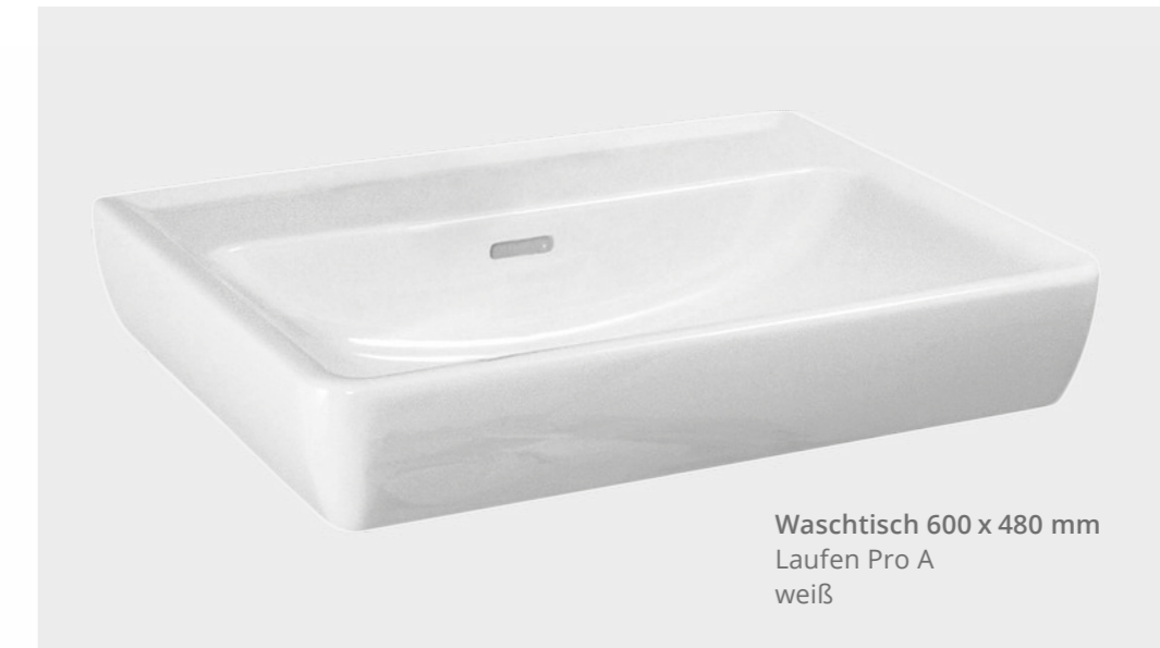
Waschtisch 600 x 480 mm Laufen Pro A weiß