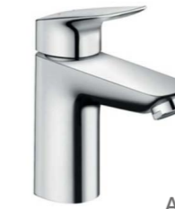
Armatur Waschtisch und Handwaschbecken Hans Grohe Logis100