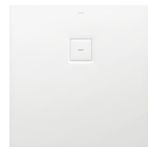
Dusche Laufen Solutions 900 x 900 mm oder 800 x 800 mm (Top 13.3)