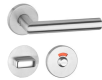
Türbeschläge Glutz Topaz