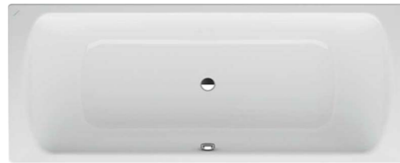
Badewanne 1 Laufen Pro 1800 x 800 mm