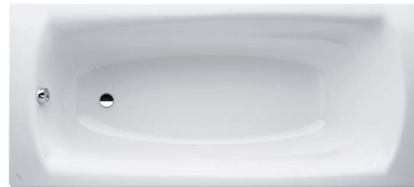
Badewanne 2 STG 1|Top 16 STG 2|Top 12 STG 3|Top 16+17 STG 4|Top 13+14