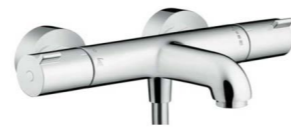
Wannen-Thermostat Hans Grohe Ecostat 1001CL