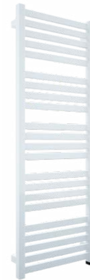
Sprossenheizkörper Etherma BHK elektrisch, weiß ohne Regelventil mit Direktanschluss