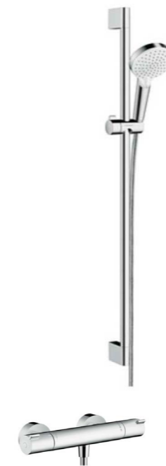
Dusch-Thermostat Hans Grohe Ecostat 1001CL Brausesystem Crometta Vario