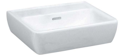
Handwaschbecken Laufen Pro A, weiß 450 x 340 mm