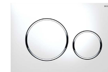
Betätigungsplatte Geberit Sigma 20 weiß mit Designring